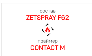
максимальная совместимость МАКСИМАЛЬНАЯ АДГЕЗИЯ