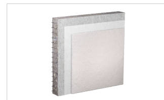
огнезащита железобетонных конструкций